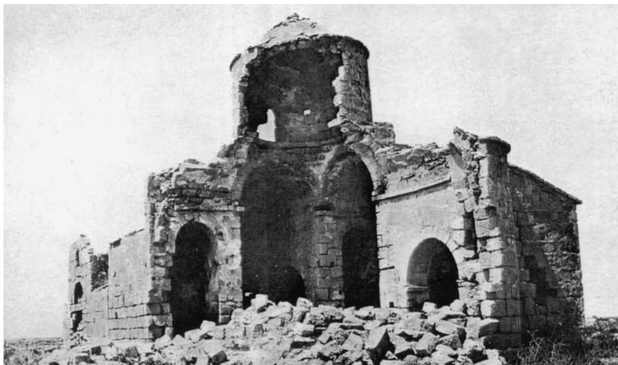
Εικ. 1: Άγιος Γεώργιος Χορτακίων. Νοτιοανατολική άποψη (φωτ. Γ. Σωτηρίου, 1931).

Μοναδικό αδιατάρακτο παράθυρο της αρχικής φάσης αποτελεί το μονόλοβο άνοιγμα που υπάρχει στο πάνω μέρος του τυμπάνου του βόρειου σκέλους (εικ. 5). Η μορφή του αντίστοιχου παράθυρου στη νότια πλευρά δεν είναι γνωστή. Ενδέχεται να ήταν και εκείνο μονόλοβο, όπως αποκαταστάθηκε κατά την ανακατασκευή ολόκληρου του νοτιοανατολικού τμήματος του ναού (εικ. 2). Ανακατασκευασμένο είναι και το μονόλοβο παράθυρο της ημικυλινδρικής αφίδας του ιερού, η αρχική μορφή του οποίου παραμένει άγνωστη. Η βόρεια παρειά ενός ανοίγματος που διακρίνεται σε φωτογραφία αρχείου θα μπορούσε να αποτελεί το υπόλειμμα ενός μονόλοβου ή και δίλοβου παράθυρου (εικ. 1). Από την ίδια φωτογραφική λήψη, που έγινε