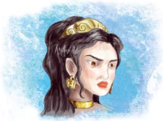
Η Ήρα και ο Δίας.