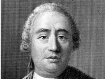
David Hume, Σκωτσέζος ιστορικός και φιλόσοφος, που επηρέασε την ανάπτυξη δύο σχολών φιλοσοφίας, του σκεπτικισμού και του εμπειρισμού.

Επομένως, η πραγματικότητα που αντιλαμβανόμαστε, είναι το αποτέλεσμα της προσπάθειάς μας, να κατανοήσουμε τα πράγματα, διαμορφωμένη από τη δική μας σκέψη η οποία, δίνει τη μορφή που εκείνη θέλει, αφού έχει δεχτεί και την αυθαίρετη συμβολή της φαντασίας μας. Άρα, η πραγματικότητα δεν είναι αντικειμενική. Υποτάσσεται στις δικές μας απόψεις και θελήσεις.