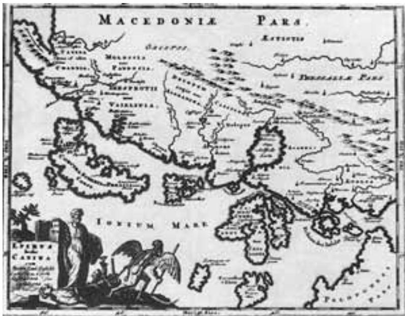
Εικ. 6. P. Cluverius, «Epirus hodie Canina cum maris Ioniis Insulas Corcyra seu Corfu, Cephalonia seu Cefalogna ...», Introductionis in Universam Geographiam , 1624 κ.ε. Αθήνα, Συλλογή Μαργαρίτας Σαμούρκα.