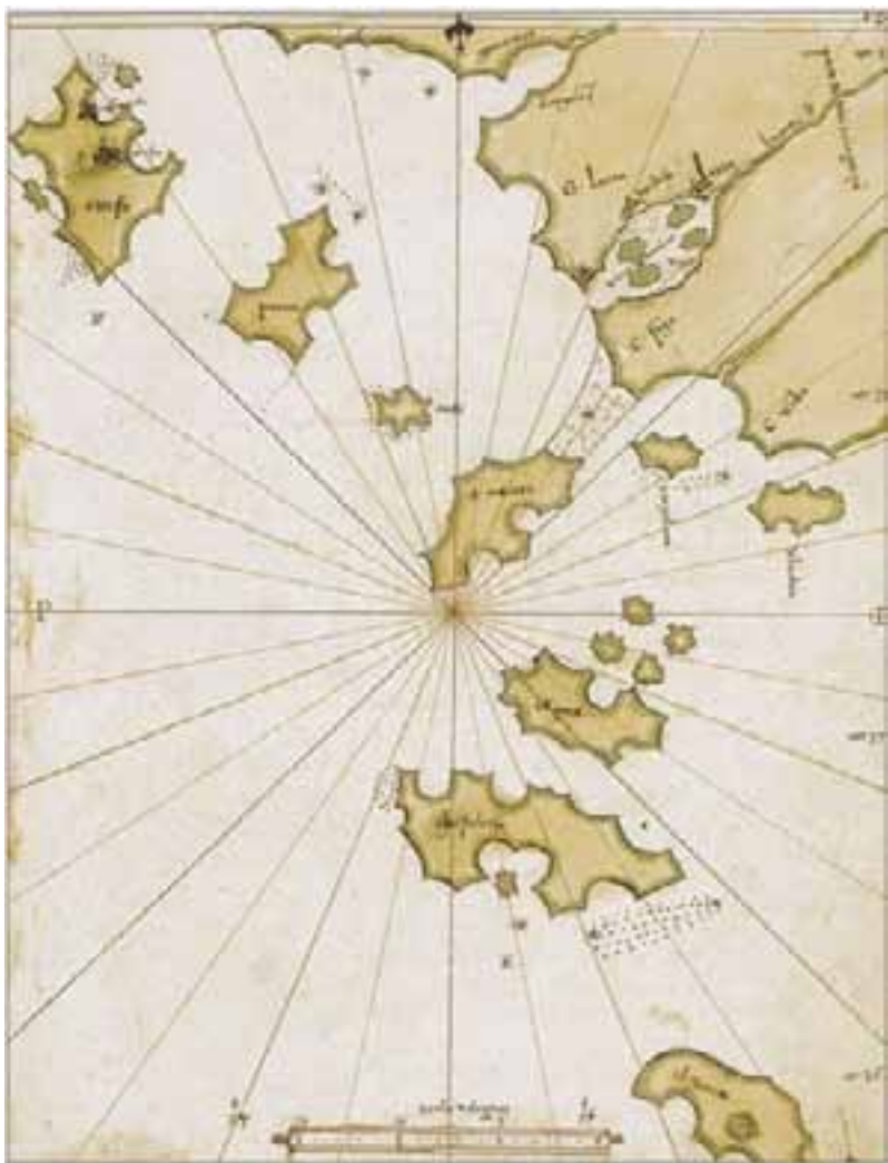
Εικ. 1. Alonso de Santa Cruz, «τα νησιά του Ιονίου Πελάγους». Ο χαρτογράφος συνδυάζει αρχαίες πηγές και ναυτικές παρατηρήσεις. Χειρόγραφο, 1545, Μαδρίτη, Εθνική Βιβλιοθήκη, Res. 138, φ. 135.