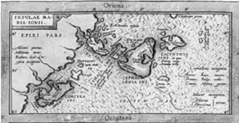
Εικ. 4. Abraham Ortelius, « Insulae Maris Ionii » λεπτομέρεια από τον ιστορικό μωσαϊκό χάρτη της Κρήτης, της Κορσικής και της Σαρδηνίας. Αμβέρσα 1584. Αθήνα, Συλλογή Μαργαρίτας Σαμούρκα.

σύντομους τοπωνυμικούς πίνακες, στους οποίους παρατίθεται η ομηρική ονοματολογία των νησιών.