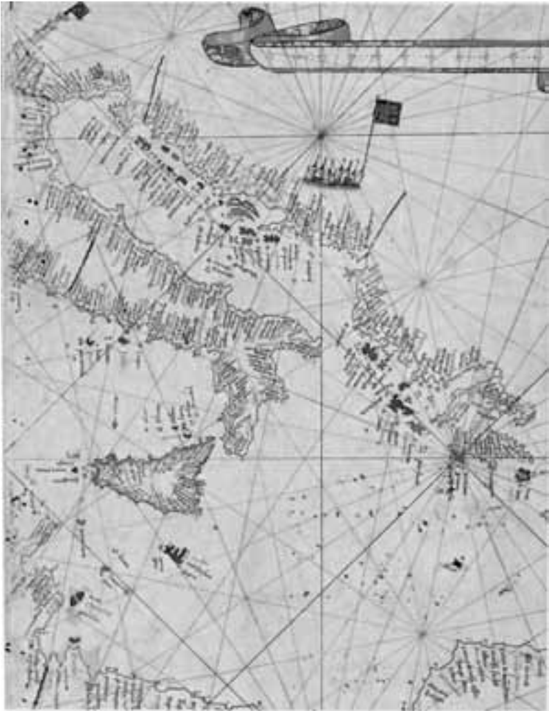
Εικ. 3. Visconte Maggiolo, «Ο κόλπος της Βενετίας», Χειρόγραφος ναυτικός χάρτης του 1512, Πάρμα, Παλατινή Βιβλιοθήκη, π. 1614.