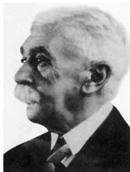
Εικόνα 2. Pierre de Coubertin, αναβιωτής των σύγχρονων Ολυμπιακών Αγώνων και δεύτερος πρόεδρος της Δ.Ο.Ε.

Όμως η ιδέα για την αναβίωση των Ολυμπιακών Αγώνων με τη μορφή διεθνούς αγωνιστικού συναγερμού, ανήκει στο Γάλλο φίλαθλο και παιδαγωγό Pierre de Coubertin (Πιέρ ντε Κουμπερτέν), απόγονο παλιάς οικογένειας και ευπατρίδη πραγματικό. Ο Coubertin είχε ταξιδέψει στην Ελλάδα πολλές φορές για να μυηθεί επί τόπου και να συλλάβει το αθλητικό κλασικό πνεύμα στον «τόπο της πόλεως των