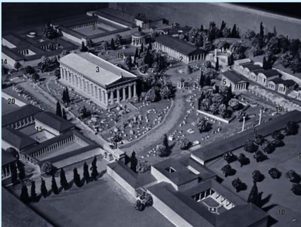
Εικόνα 1. Αναπαράσταση του ιερού της αρχαίας Ολυμπίας