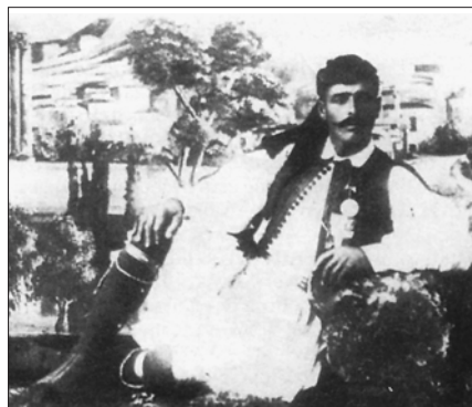
Εικόνα 4. Σπύρος Λούης, ο νικητής του Μαραθώνιου στην Ολυμπιάδα των Αθηνών 1896

Οι στίχοι του Κωστή Παλαμά αντίχησαν και συγκλόνισαν την ψυχή των θεα-