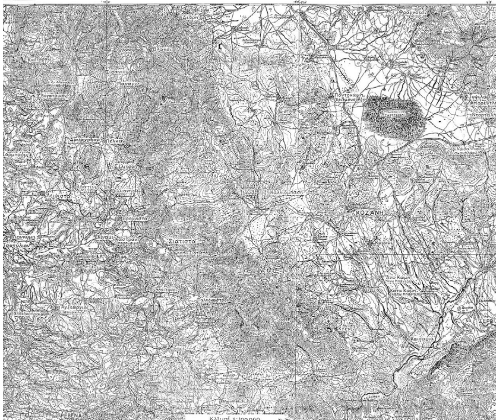
ΧΑΡΤΗΣ ΤΗΣ ΠΑΡΑ ΤΟΝ ΑΛΙΑΚΜΟΝΑ ΧΩΡΑΣ ΜΕΤΑΞΥ ΚΟΖΑΝΗΣ ΚΑΙ ΤΣΟΥΛΙΟΥ