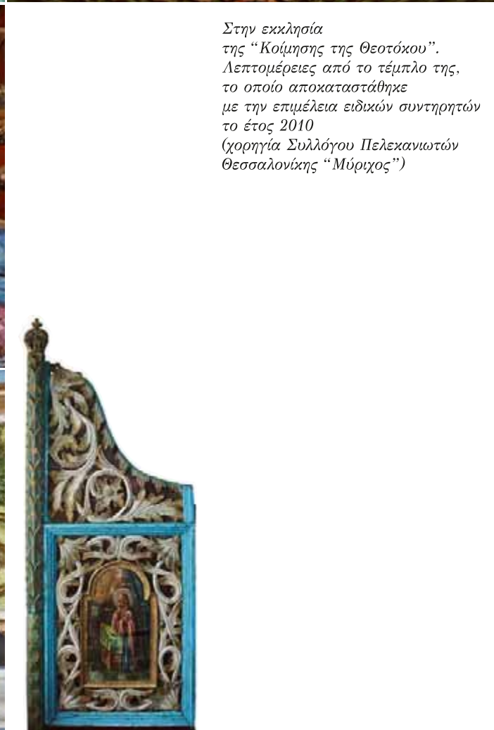
Στην εκκλησία της "Κοίμησης της Θεοτόκου". Λεπτομέρειες από το τέμπλο της, το οποίο αποκαταστάθηκε με την επιμέλεια ειδικών συντηρητών το έτος 2010 (χορηγία Συλλόγου Πελεκανιωτών Θεσσαλονίκης "Μύριχος")