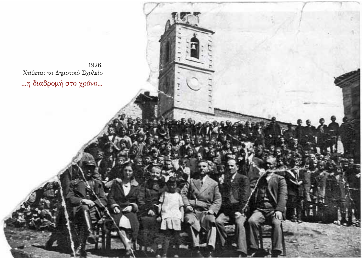
Στη δεκαετία '30-'40.