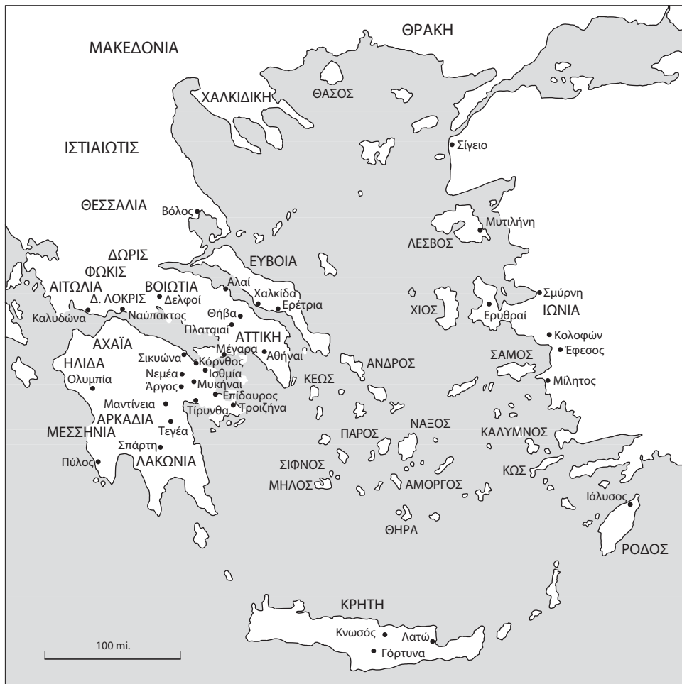
Χάρτης 0.1. Το Αιγαίο.