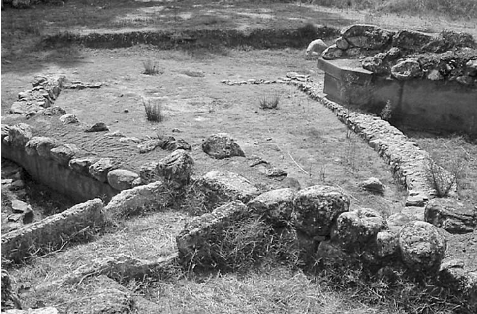
Εικόνα 4.2. «Αρχηγική» οικία στην Ερέτρια (φωτογραφία του συγγραφέα).

8 ου αιώνα (Κτίριο 1), η οποία εύλογα έχει αναγνωριστεί ως η οικία του τοπικού άρχοντα, φαίνεται πως συνέχισε να χρησιμοποιείται και μετά την κατασκευή ενός μνημειακού ναού δίπλα της, γύρω στο 725.