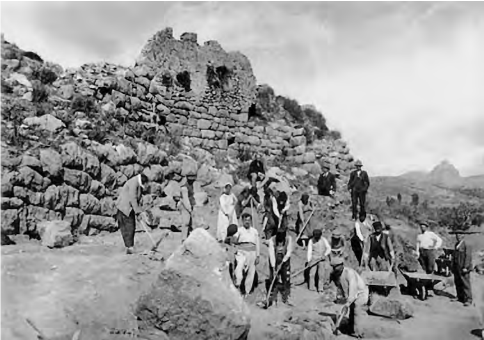
Εικόνα 3. Εργάτες και εργάτριες στις ανασκαφές της Ασίνης. Φωτογραφία ίσως του 1926.

γραφείου διακρίνεται για το αστυνομικό του δαιμόνιο, κάτι σαν τον Ηρακλή Πουαρό. Στο Έγκλημα στη Μεσοποταμία ο δολοφόνος, που τυχαίνει να είναι αρχαιολόγος, λέει στον διάσημο επιθεωρητή: «Θα γινόσασταν καλός αρχαιολόγος, κύριε Πουαρό. Έχετε το χάρισμα να ανασυνθέτετε τον παρελθόν» (Christie 1994 [1936]: 215).