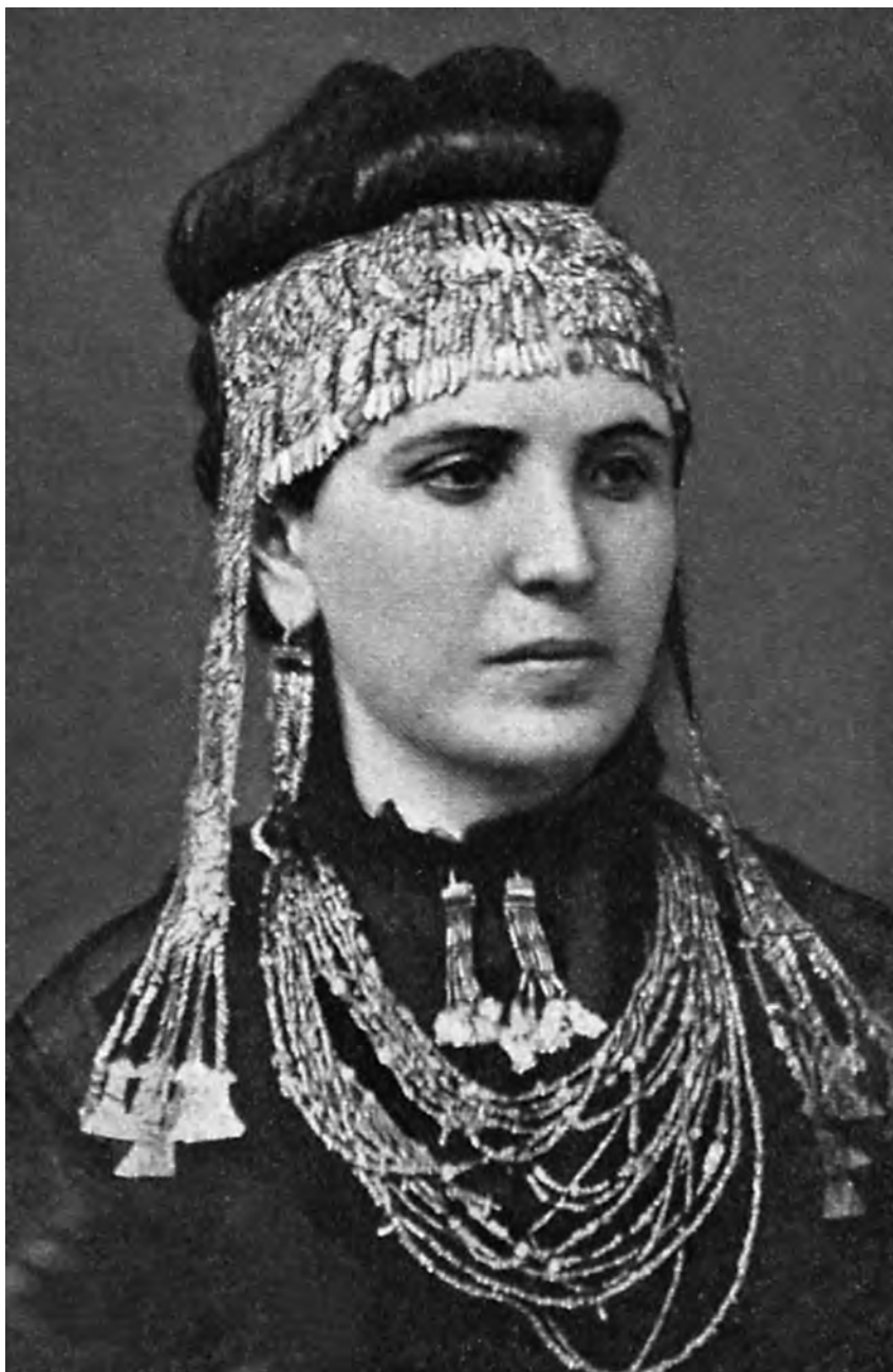
Εικόνα 9. Η Σοφία Εγκαστρωμένου-Schleimann (1852-1932) με τα κοσμήματα από τον «θησαυρό του Πριάμου», 1876.