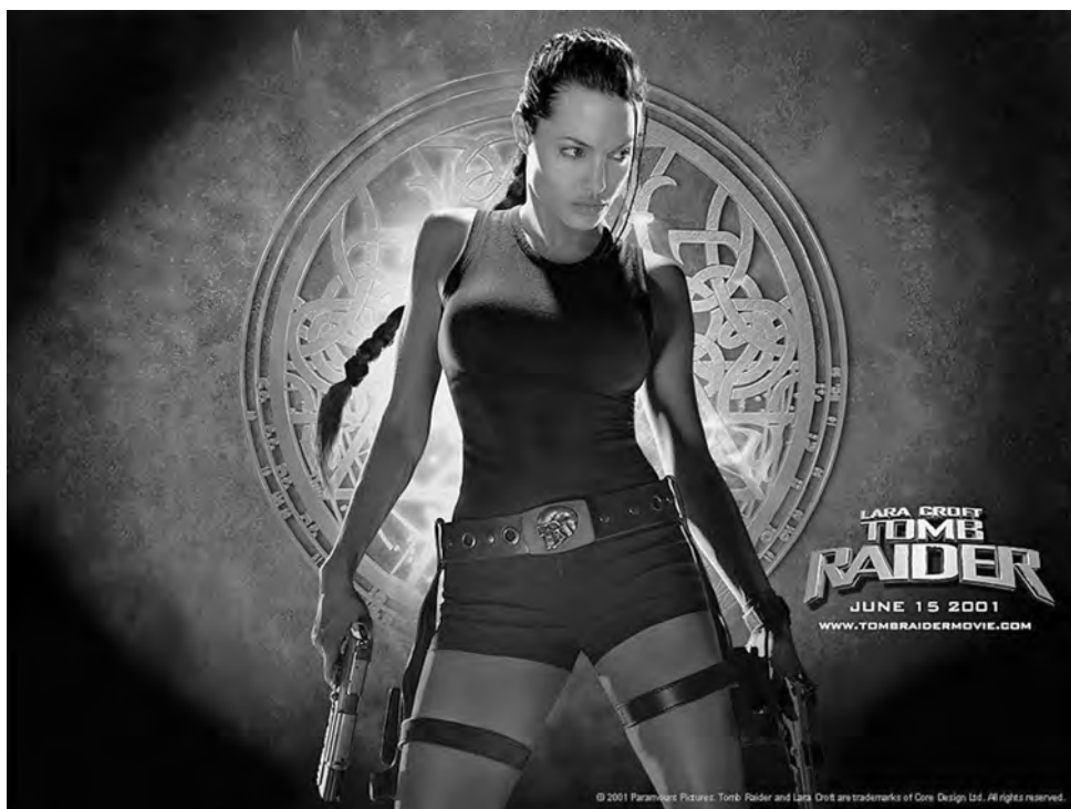
Εικόνα 6. Η Lara Croft τυμβωρύχος. Angelina Jolie, σκηνοθεσία Simon West, 2001.

χίας στο παρελθόν, σε μία προσπάθεια να κατανοήσει το παρόν ενός κόσμου που έβγαινε από τα ερείπια. Στη μετάβαση από την «απώλεια της αθωότητας» (Clarke 1973) στον ρεαλισμό πρωτοστατεί η προϊστοριολογία. Είναι η εποχή της Νέας Αρχαιολογίας που, συνεπαρμένη από τον θετικισμό, συστήνεται ως «σκληρή» επιστήμη, ικανή να φέρει στο φως την αλήθεια. Απομακρύνεται από τις φιλολογικές επιρροές για να στραφεί σε εθνογραφικές παραλληλίες. Εφαρμόζει τις αρχές της εμπειρικής παρατήρησης και του εργαστηριακού ελέγχου, με τη φιλοδοξία να προβλέψει, μέσω κανονιστικών υποθέσεων εργασίας, την ανθρώπινη συμπεριφορά ανεξαρτήτως χρόνου και τόπου. Αντιλαμβάνεται τον πολιτισμό ως σύστημα από αλληλένδετα υποσυστήματα – μέσα προσαρμογής στο φυσικό περιβάλλον. Εστιάζει την προσοχή της στα οικιστικά συστήματα επιβίωσης, τα κοινωνικοτεχνικά υποσυστήματα και τους παράγοντες που τα επηρεάζουν, όπως οι δημογραφικές πιέσεις ή οι πιέσεις εξαιτίας της έλλειψης πόρων. Ερμηνεύει την ιδεολογία και τον συμβολισμό ως προβλέψιμα παράγωγα της υλικής βάσης – μηχανισμούς κοινωνικής συνοχής ή επιβολής κατά περίπτωση – όταν δεν τα κρίνει απροσπέλαστα. Δεν είναι επομένως παράδοξο που από τις νεοαρχαιολογικές προσεγγίσεις απουσιάζει