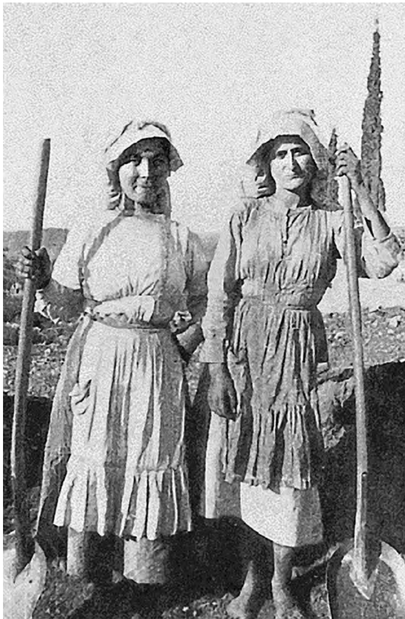
Εικόνα 2. Εργάτριες στις ανασκαφές της Ασίνης, 1922. Εθνικά Αρχεία Σουηδίας. Πηγή: Καθημερινή , ένθετο «Επτά Ημέρες», αφιέρωμα «Εργαζόμενες γυναίκες: η είσοδος των γυναικών στη μισθωτή εργασία», 2 Μαΐου 1999, σελ. 3.