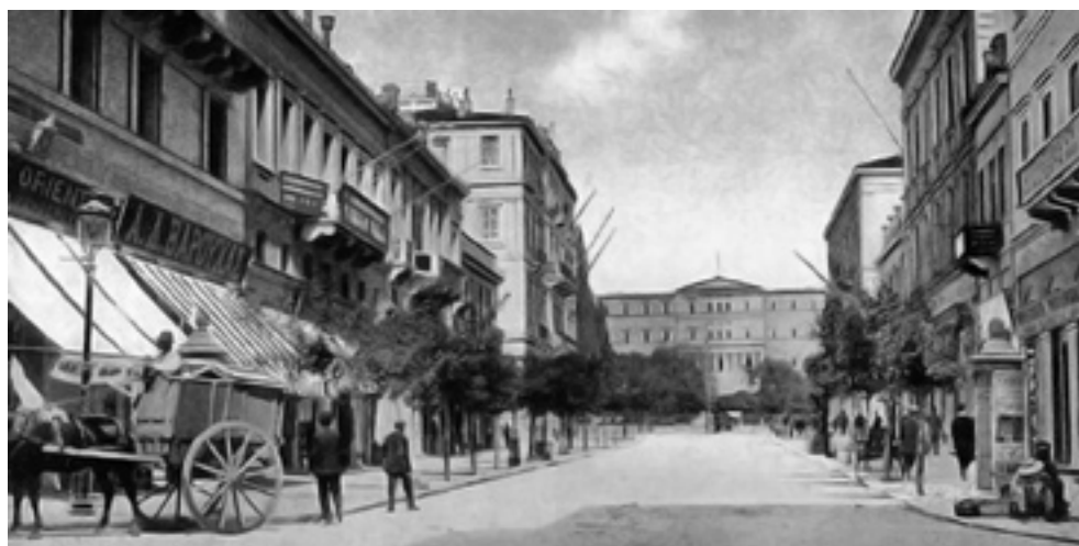
Η Αθήνα τον 19ο αιώνα