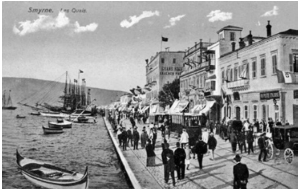
Η Σμύρνη τον 19ο αιώνα. Η προκυμαία συγκέντρωνε τα πολυτελή καταστήματα, ξενοδοχεία, καφέ-ζαχαροπλαστεία και προξενεία.