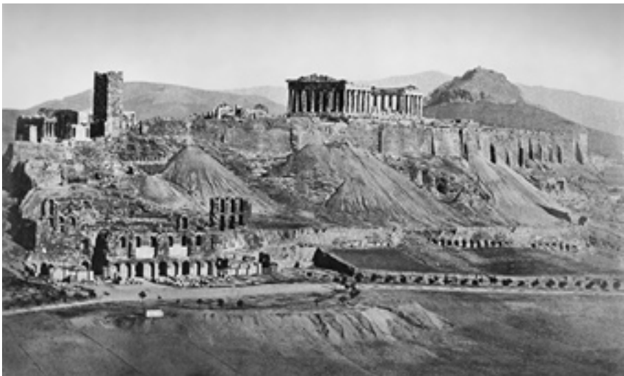
Η ακρόπολη το 1900.

Το πολιτικό αδιέξοδο, που απεικονίζεται και στη γελοιογραφία, οδήγησε στην εκδήλωση του κινήματος του Στρατιωτικού Συνδέσμου το 1909 στο Γουδί, που αποτέλεσε τομή στην πολιτική ιστορία της Ελλάδας γενικότερα και των πολιτικών κομμάτων ειδικότερα, εκφράζοντας τη λαϊκή απαίτηση για μεταρρυθμίσεις και πάταξη της διαφθοράς και της συναλλαγής.