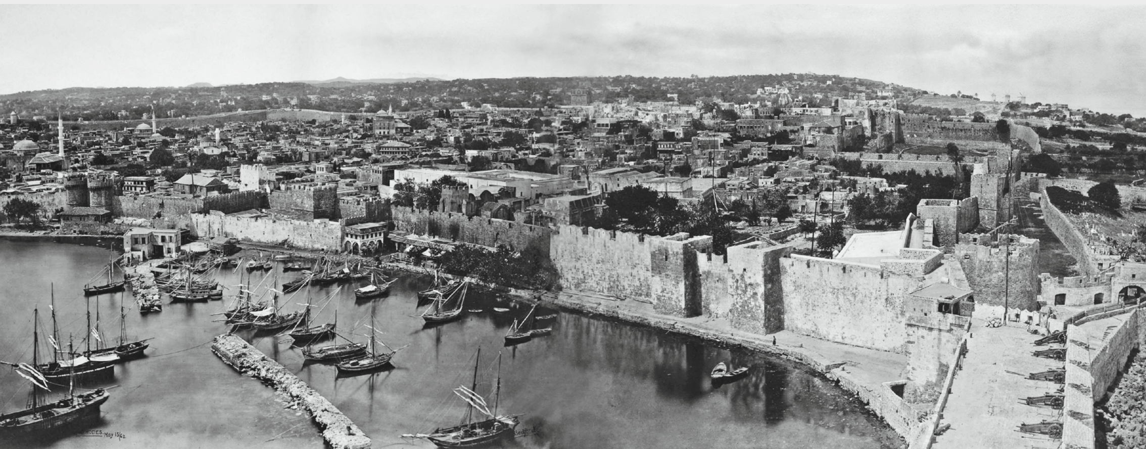
Πανοραμική άποψη της Παλιάς Πόλης. Φωτογραφικές λήψεις από τον Πύργο του Naillac πριν από την καταστροφή του. Φωτογραφία: Francis Bedford, 15 Μαΐου 1862.