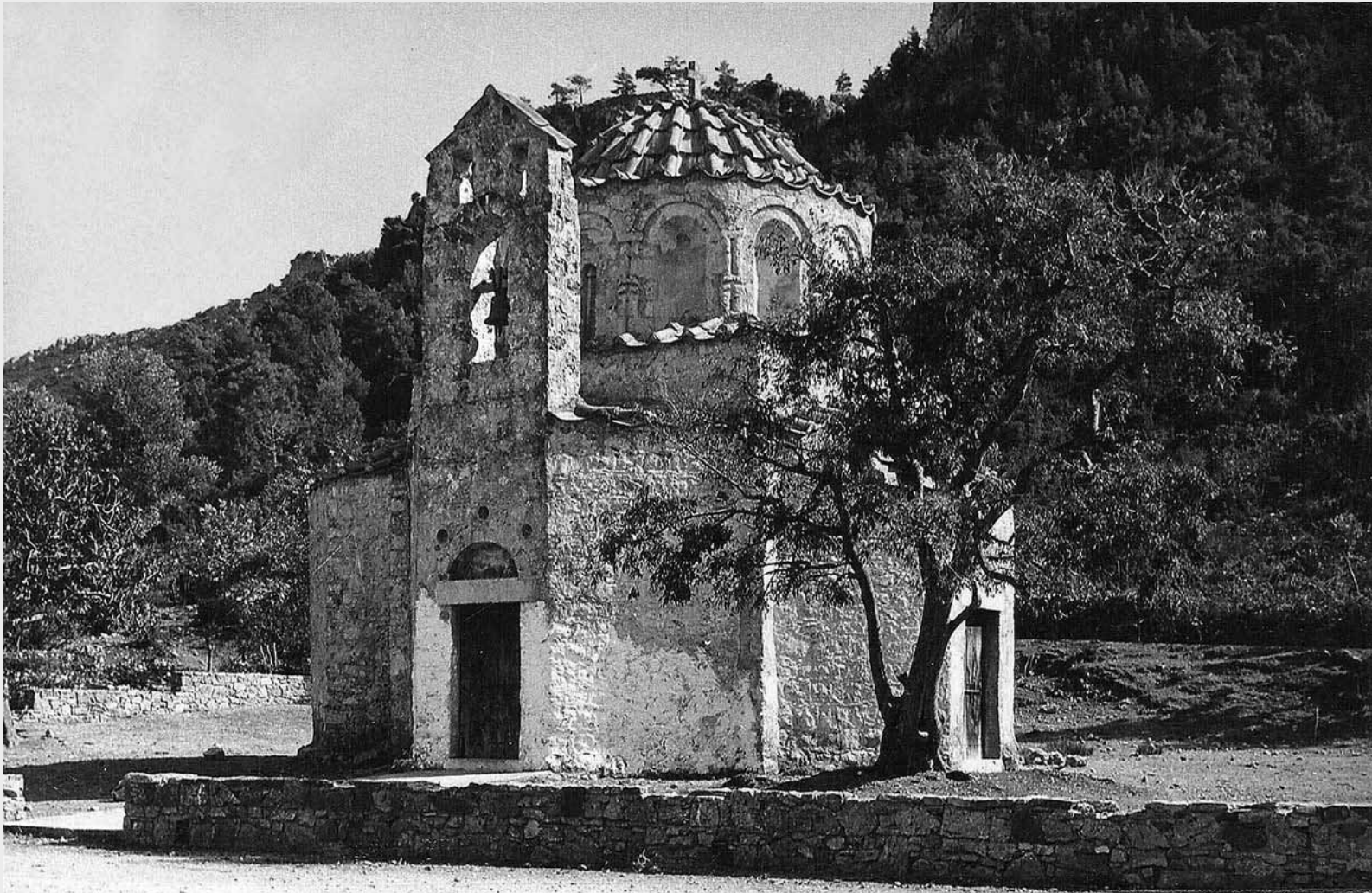
Το μοναστήρι του Αγίου Νικολάου του Φουντουκλή. Φωτό: Ιωάννης Κοζάς, 1950.