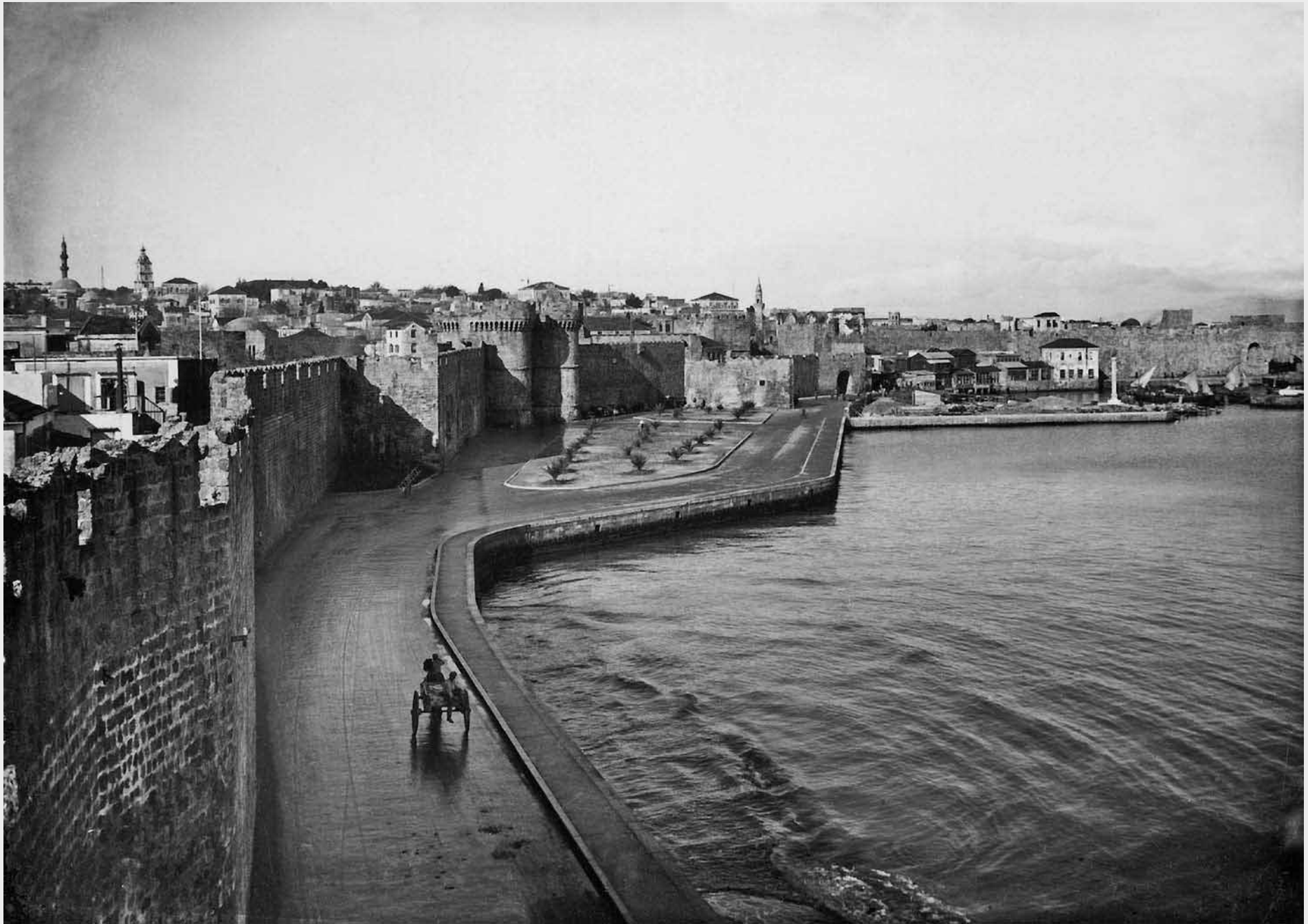
Η εκτός των τειχών περιμετρική οδός.