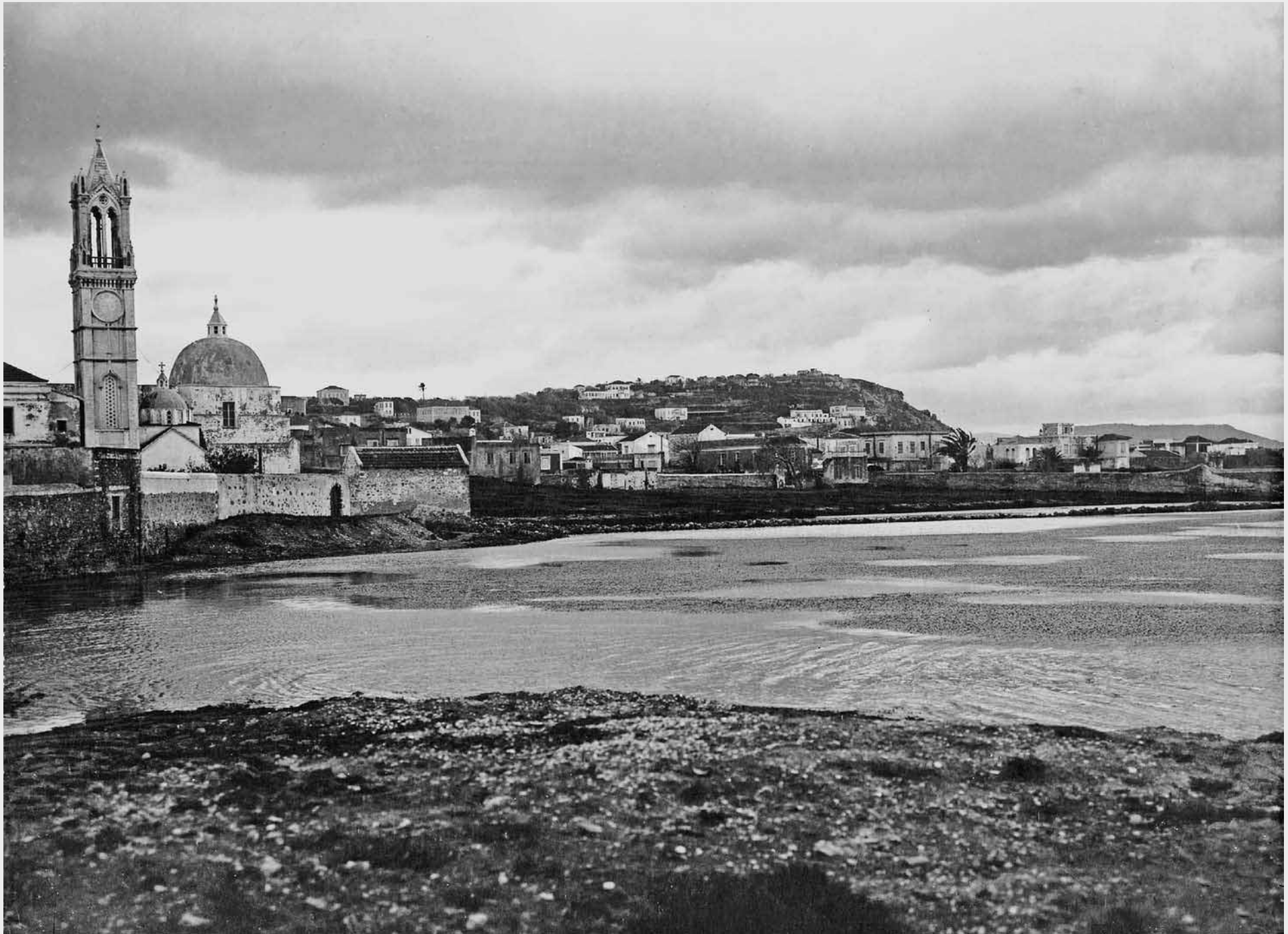
Πανοραμική άποψη του Νιοχωριού (Istituto Risorgimento Italiano).