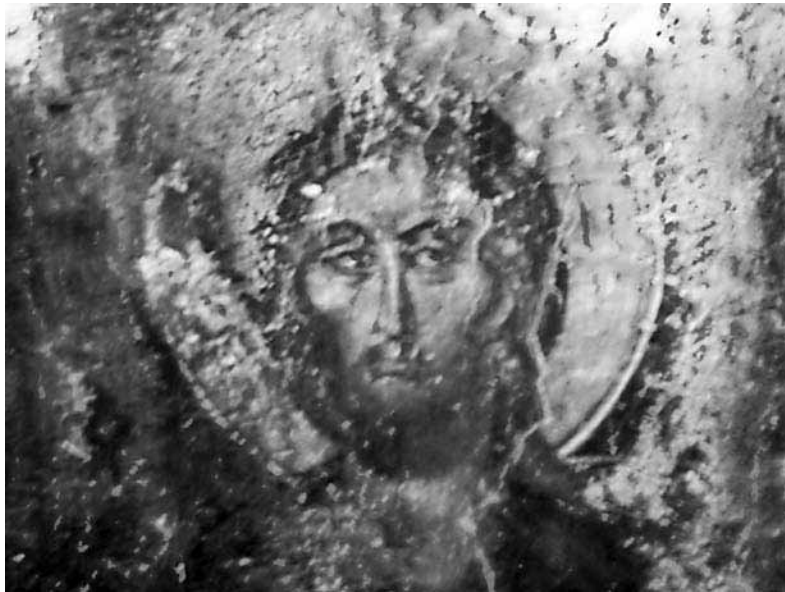
Ο Χριστός από την Δέηση

Τα καλοκαίρια επισκεπτόμασταν συχνά το 'Ιαματικό' με φίλους και επισκέπτες για να θαυμάσουμε την τέχνη του αγιογράφου που το ιστόρησε, δείγμα αξιόλογης ζωγραφικής σε ταπεινά μοναστήρια αιπόλων. Ύστερα καθόμασταν στην σκιά του μεγάλου πεύκου για να ξεκουραστεί ο άγγελος, καθώς λένε στη Κρήτη.